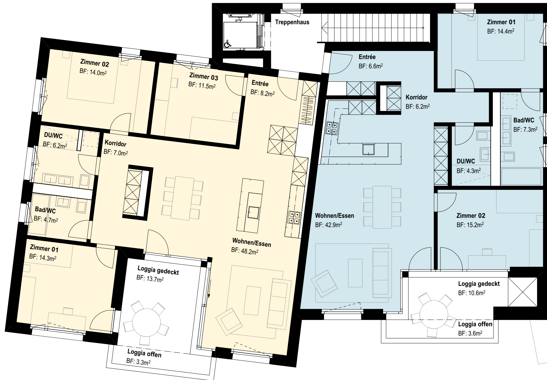
Wohnung 14.132 | Attika 4½ Zimmer, WF = 118.0m 2 Loggia = 17.0m 2